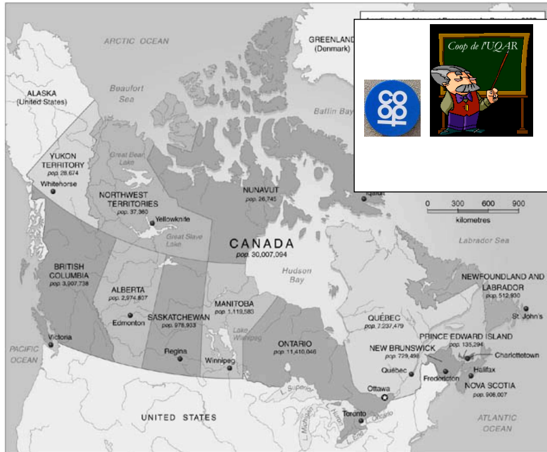
Map of Canada